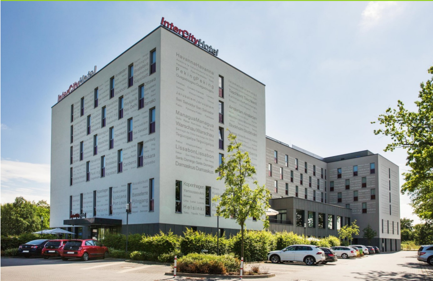
InterCity Hotel Schönefeld, Tagungsort des 27. Landeskongresses 2022