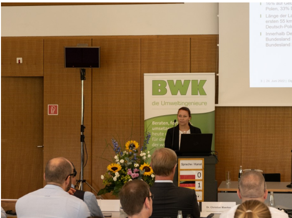
Teilnehmerinnen und Teilnehmer

Der BWK hat im Jahr 2012 begonnen, einzugsgebietsbezogene wasserwirtschaftliche Fachtagungen durchzuführen, um einen bundesländerübergreifenden Informationsaustausch komplexer hydrologischer, ökologischer und gütemwirtschaftlicher Fragestellungen anzustoßen und die an unterschiedlicher Stelle tätigen Fachkolleginnen und Fachkollegen miteinander ins Gespräch zu bringen. Beim BWK Odertag sollte 25 Jahre nach der Hochwasserkatastrophe von 1997 länderübergreifend Bilanz gezogen werden: Was wurde erreicht; was ist zu tun? Wie ist der Hochwasserschutz entlang der Oder im Falle zukünftiger Hochwasserereignisse gerüstet? Wie gestaltete sich die Umsetzung nötiger Maßnahmen in den betroffenen Ländern? Welche Planungen gibt es für die Zukunft?