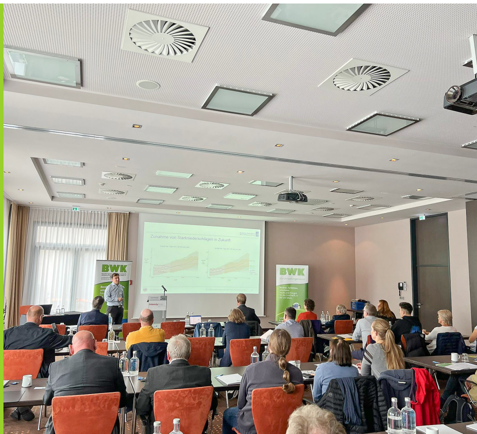
27. Landeskongress „Urbane Sturzfluten—Wasserwirtschaft und Klimawandel“