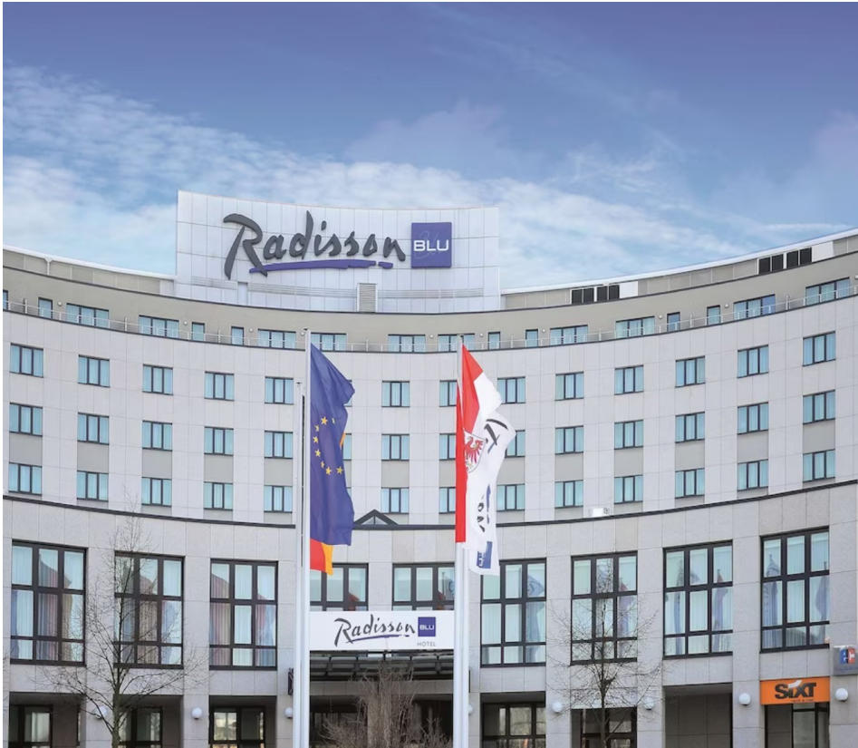
Radisson BLU Hotel Cottbus